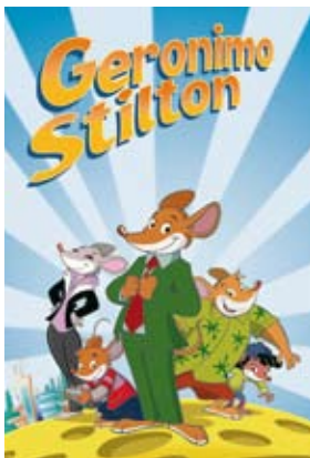
Tit & © Altmyra S.p.A. Animated Series © 2009 Altmyra S.p.A. - MoonScoop S.A.S. - All Rights Reserved

Siete pronti per una gustosissima anteprima? Assaggiamo un episodio della prima serie animata dedicata al topo giornalista! L'infaticabile Geronimo, a pochi giorni dall'uscita del suo nuovo libro Quinto viaggio nel regno della fantasia , è pronto per raccontare le sue stratopiche avventure anche in TV. Godiamoci un episodio dei cartoni animati di Geronimo Stilton, per un'anteprima... da leccarsi i baffi! Le avventure di Geronimo Stilton continuano su Rai2.